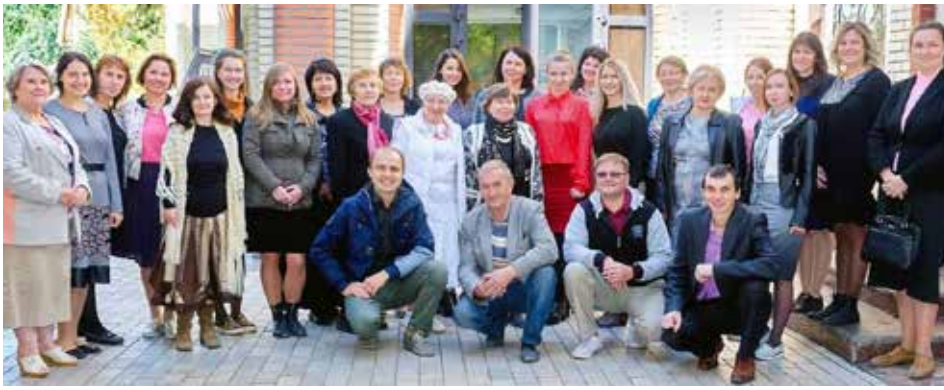
Team van de River of Life School

Sinds 2010 werkt de school aan het project 'Special Educational Needs' om kinderen met een specifieke leerstoornis te helpen. We hebben lessen op maat voor deze kinderen. Voor ouders en leerkrachten organiseren we speciale bijeenkomsten.