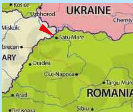
Ligging Satu Mare

In de provincie Satu Mare bevinden zich vijfenveertig gemeenten van de Hongaars Gereformeerde Kerk, die bediend worden door ongeveer evenveel predikanten. Vijf van deze gemeenten zijn wijkgemeenten van de stad Satu Mare. Gezamenlijk zorgen ze voor het in standhouden van een scholengemeenschap in Satu Mare. Vooral ook door ouders sterk te stimuleren hun kinderen daar naar school te sturen. Het resultaat is een goed lopende scholengemeenschap voor ongeveer 670 kinderen in de leeftijd van 3 tot en met 18 jaar.