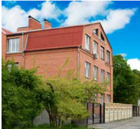
De River of Life School

nen en helpen, wat onze school tot één grote familie maakt.