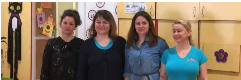
Team van de kleuterschool