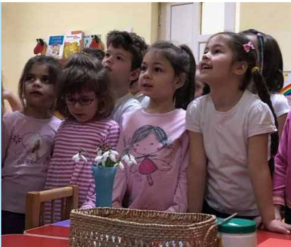
Leerlingen van de kleuterschool te Satu Mare

Voorafgaand aan de periode van het communisme waren in diverse grotere steden in Transsylvanië kerkelijk gebonden scholen voor voortgezet onderwijs. Deze werden Collegiums genoemd. Zij werden bestuurd door of namens de bisschop.