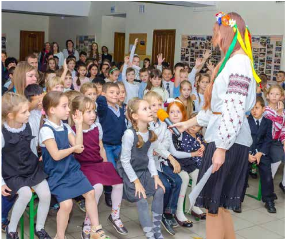
Bijeenkomst ter gelegenheid van het 20-jarig bestaan van de River of Life School