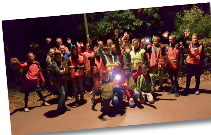
Sponsorloop in de nacht