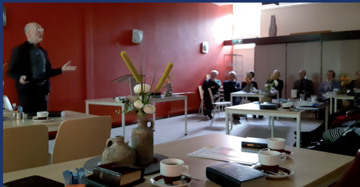
Meeleven in Ridderkerk