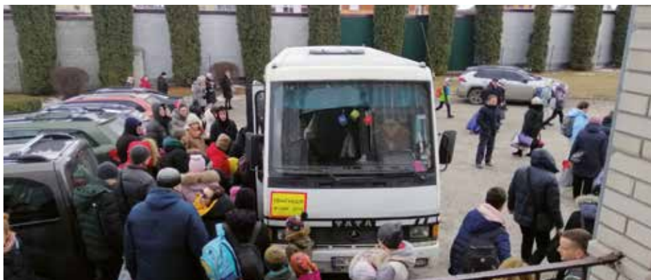
Een bus met vluchtelingen vertrekt naar het buitenland

Op 24 februari jl. viel Rusland Oekraïne binnen. Honderden scholen en andere educatieve instellingen werden verwoest. Hoe is de stand van zaken met betrekking tot de christelijke scholen nu? In dit artikel een impressie van de situatie voordat