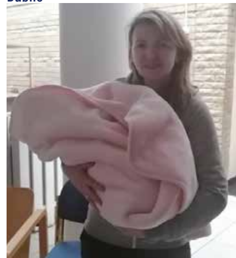
Vertrek uit Zhitomir