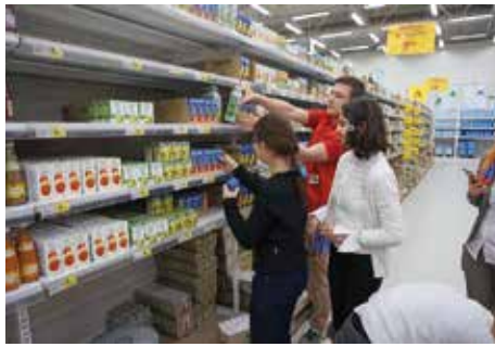
Vakken vullen in supermarkt Auchan

Vandaag hebben we juist weer overleg gehad met de directie van het 'Radisson Blu' hotel in Kiev. Dit semester zal er weer volop worden samengewerkt. Afhankelijk van de doelstelling van de praktijklessen, zullen onze kinderen of in het hotel aan de slag gaan, of komt het personeel weer naar de school toe.