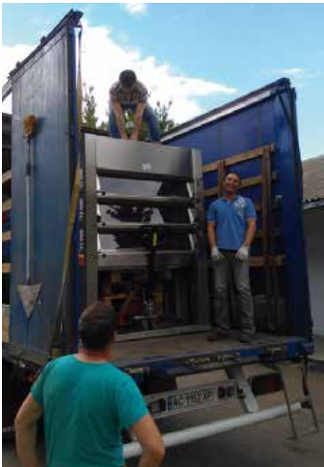
De bakkerij in wording