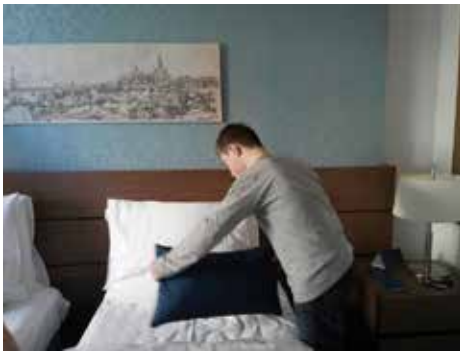
Medewerkers van het Radisson Blu hotel blijven de school trouw bezoeken en de kinderen trainen in het schoonmaken, serveren en bedienen. Ook zijn de leerlingen regelmatig op leerexcursie geweest naar het hotel. De laatste keer mochten de kinderen bedden opmaken.