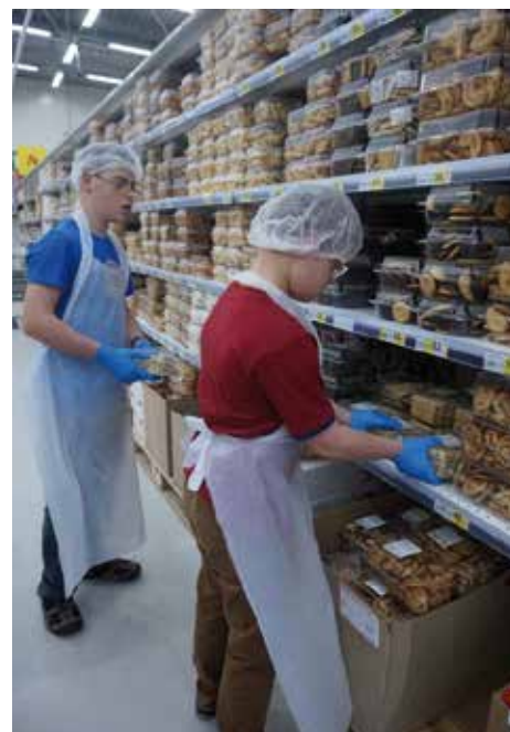
Lliya en Petro in hypermarkt Auchan

Op dit moment zijn de kinderen dus nog gewoon op school aan het leren, met af en toe een leerexcursie.