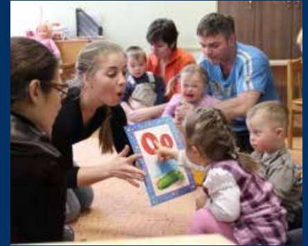
Early Development Center Down Syndrome