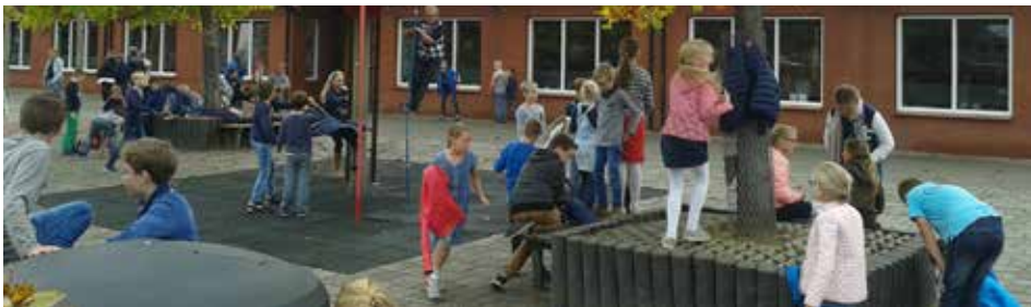
Leerlingen van de Rehobothschool

De Rehobothschool in Geldermalsen heeft vorig jaar besloten om het zendingsgeld in de derde periode van het schooljaar aan een wisselend doel te besteden. In de laatste 13 weken van het afgelopen schooljaar hebben de kinderen maar liefst € 2832,58 voor Stichting OGO gespaard! Het geld is bestemd voor (Bijbel)onderwijs aan kinderen met het syndroom van Down en voor zigeunerkinderen, de Roma-kleuters. Heel hartelijk dank!