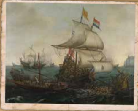
Hollandse schepen overvaren Spaanse galeien

Op 31 oktober is het precies 500 jaar geleden dat Maarten Luther een lange brief aan de kerkdeur van Wittenberg spijkerde. In deze brief had Luther geschreven over alles wat in de Roomse Kerk niet goed was. Heel veel mensen hoorden wat Luther gedaan had. Niet alleen in Duitsland, maar ook in allerlei andere landen kreeg Luther veel aanhangers. In Hongarije werden zelfs bijna alle mensen Gereformeerd!