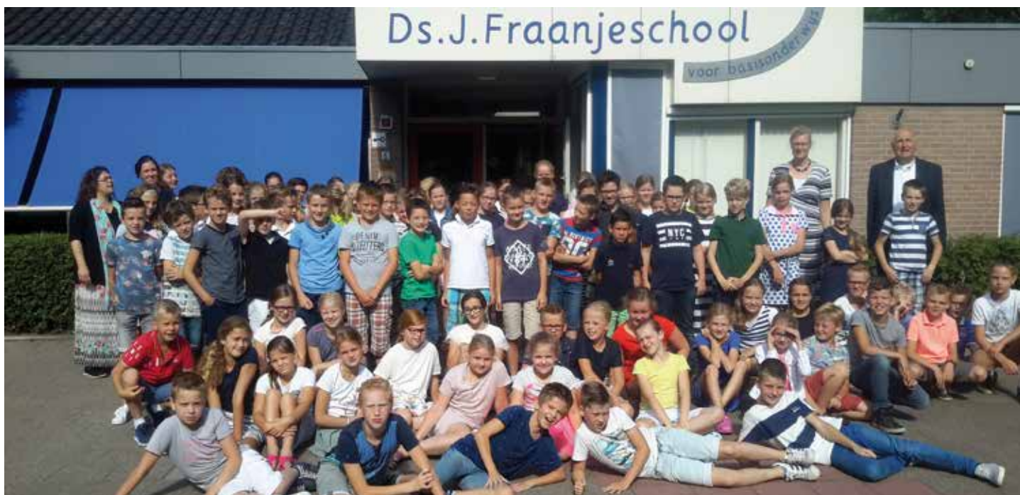
De groepen 6 en 7 van de Ds. J. Fraanjeschool