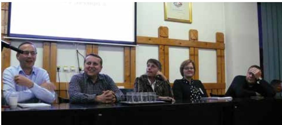
Paneldiscussie op de conferentie

Wij vonden het indringend te moeten horen hoe sterk de mentaliteit in Oost-Eu-