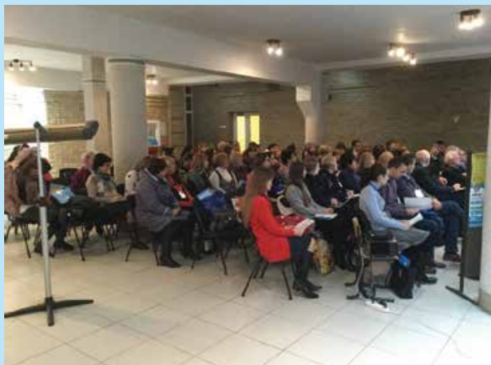
Conferentie over speciaal onderwijs in Zytomir