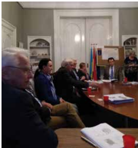
In gesprek met de ambassadeur van Oekraïne