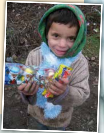
Blij met een kerstgeschenk