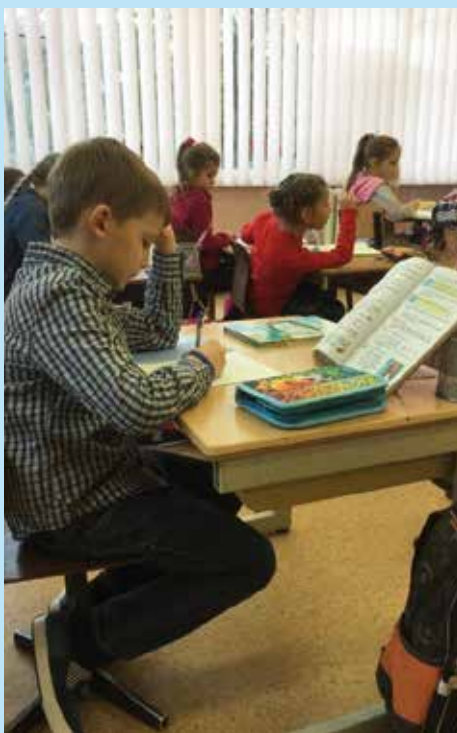
Kinderen met een beperking op de school River of Live