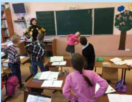
Lessen op de School of Wisdom