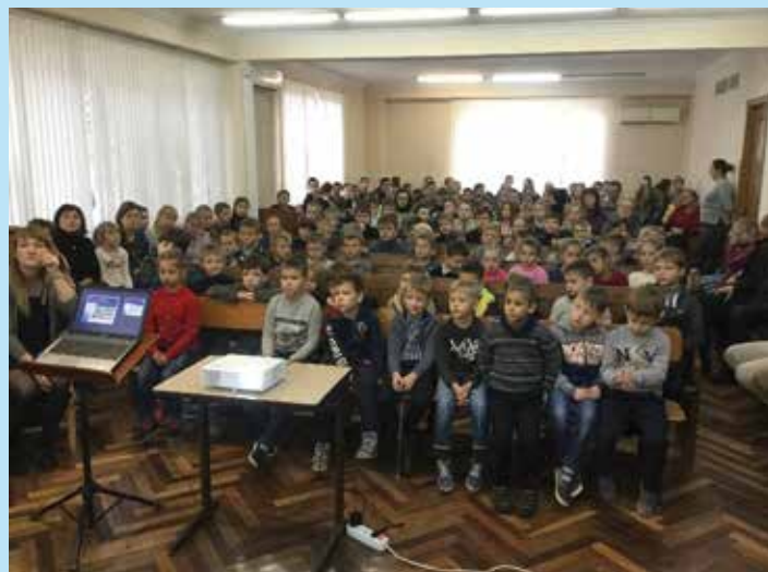
Weekopening op de School of Wisdom

Een werkbezoek aan Oekraïne geeft zoveel indrukken dat ze nauwelijks in woorden te vatten zijn, daarom enkele foto's met een paar woorden ter toelichting. Het geeft enerzijds aan in welke situatie het land en het christelijk onderwijs zich bevindt aan de andere kant laat het zien wat het christelijk onderwijs aan ontwikkeling heeft doorgemaakt. Deze ontwikkelingen zijn er onder andere doordat er mensen zijn die heel gedreven zijn.