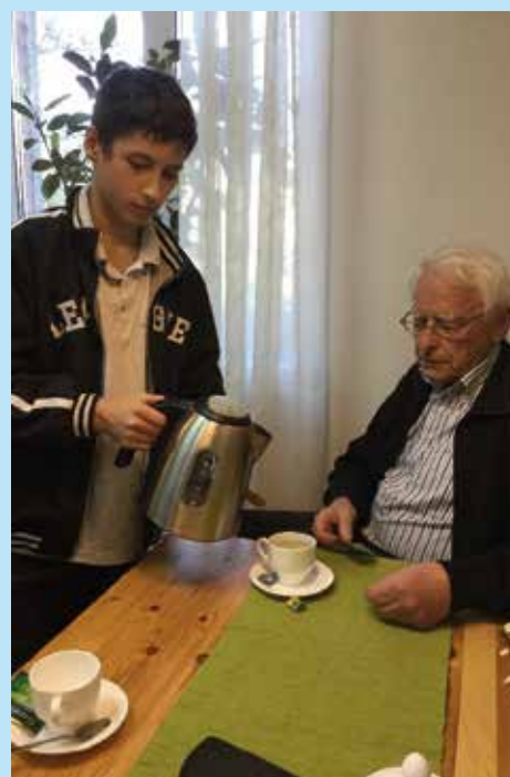
Leren bedienen in een restaurant