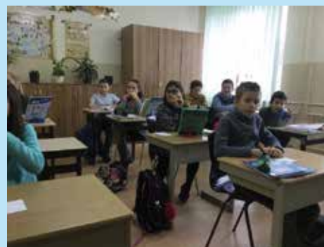
Kinderen met een beperking zitten in een normale klas maar kunnen niet altijd een aangepast programma volgen